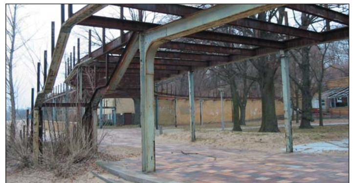
Der Arkadengang vor dem Strandrestaurant „Lido“ wird Ruine bleiben.

sperret hat. Die FDP-Fraktion fordert seit Jahren eine ‚offensive‘, d.h. stärker am Markt ausgerichtete, Bewirtschaftung des Strandbades. Es muss ein Betrieb her, der dem sich wandelnden Freizeitverhalten auch durch einen Ganzjahresbetrieb Rechnung trägt. Martin Wagners Strandbad Wannsee war innovativ und bleibt es auch als Denkmal. Somit gilt auch hier: Nur wer sich ändert, bleibt sich treu!