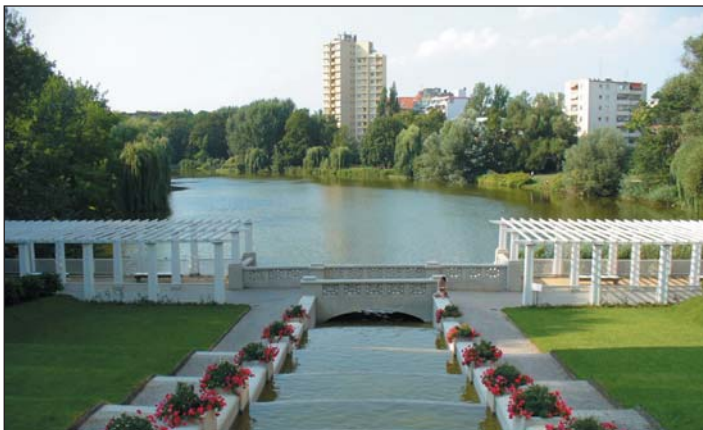
Die Lietzensee-Kaskade rauscht nach ihrer Restaurierung wieder zum Vergnügen der Anwohner, der Wasserzustrom hat die Qualität des Seewassers bereits verbessert.

betriebe, erklärte anlässlich der Übergabe des Schecks am 18. August: „Unsere immensen Investitionen in die Abwasserreinigung haben die Qualität von Spree und Havel deutlich verbessert. Wo könnte man dies besser erleben, als in einem Strandbad.“ Zur Hundertjahrfeier des Strandbades Wannsee wird die Stiftung die von ihr übernommene Aufgabe abschließen. Trotzdem bliebe noch viel zu tun. ■