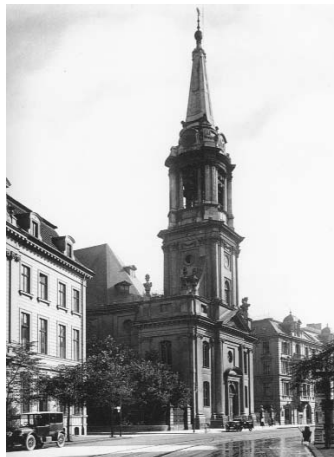
Parochialkirche vor dem Krieg. Nach Kriegszerstörung ist der Turmstumpf heute weder Mahnung gegen den Krieg noch städtebauliches Monument.