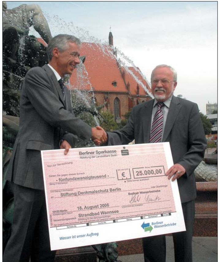
Am 18. August 2006 fand eine Scheckübergabe der Berliner Wasserbetriebe aus Anlass ihrer 150. Jahrestag „Berliner Wasser“ an unsere Stiftung Denkmalschutz statt.