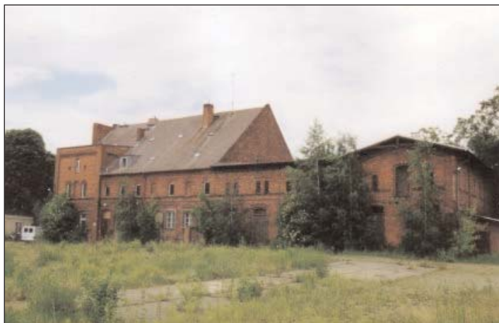
Gutsanlage Blankenfelde – der Zustand der Gebäude ist offensichtlich.

gliedert auch in das nur 2,5 km entfernt liegende ehemalige Stadtgut im östlichen Nachbardorf Blankenfelde. Das Gut befand sich im Besitz des Bezirksamtes Pankow und wurde – nachdem kein geeigneter Nutzer gefunden werden konnte – an den Liegenschaftsfonds des Landes Berlin abgegeben.