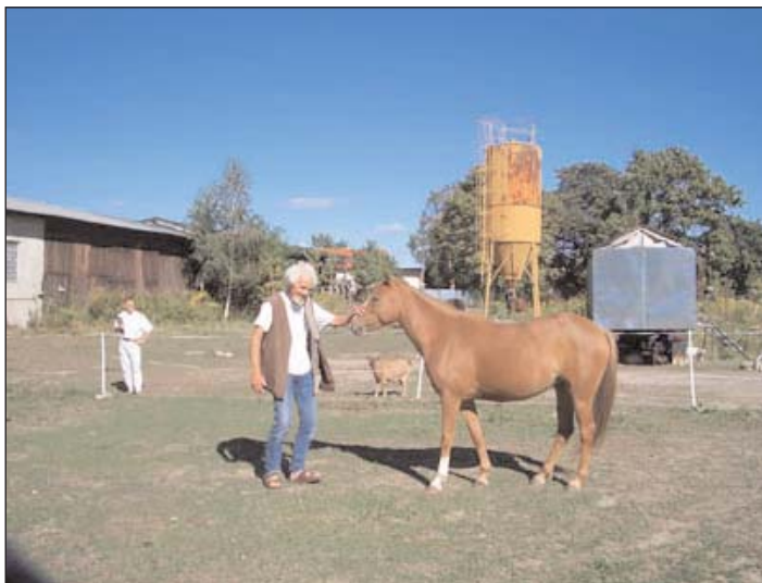
Gut Blankenfelde – Mensch und Tier treffen sich auf historischem Boden.

Aber wir wissen, dass auch in Zeiten leerer kommunaler Kassen viel