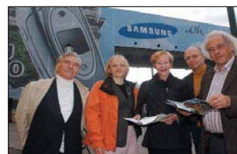
Die Gründungsmitglieder des Freundeskreises Charlottenburger Tor.

und Georg Wrba dienen. Vor allem aber wird in direkter Zusammenarbeit mit der Stiftung Denkmalschutz ein Konzept für die Gestaltung des Freiraums um das Tor erarbeitet. Erforderlich ist eine Verbesserung der Verkehrssituation zwischen Radfahrern und Fußgängern und besonders eine dem Rang des Tores entsprechende Aufwertung der Verweilqualität für Fußgänger. Diese kann durch eine sinnfällige Verknüpfung der Grünflächenzüge des Einsteinufers und des hinter der Charlottenburger Brücke beginnenden Großen Tiergartens, mit der Wiederherstellung der Aufenthaltsqualität auf der Bastion durch eine