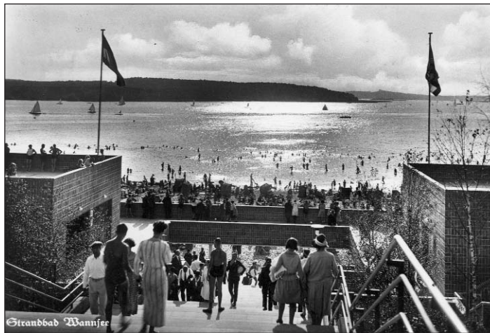
Die historische Postkarte fängt die ganze Stimmung des Strandbades ein. Der offene Raum des Großen Wannsees, das weit am Horizont gegenüberliegende bewaldete Ufer, die sich im Wasser spiegelnden Strahlen der Sonne und natürlich auch der Zustrom der Besucher, die über eine der beiden großen Treppen dem Strand zustreben.