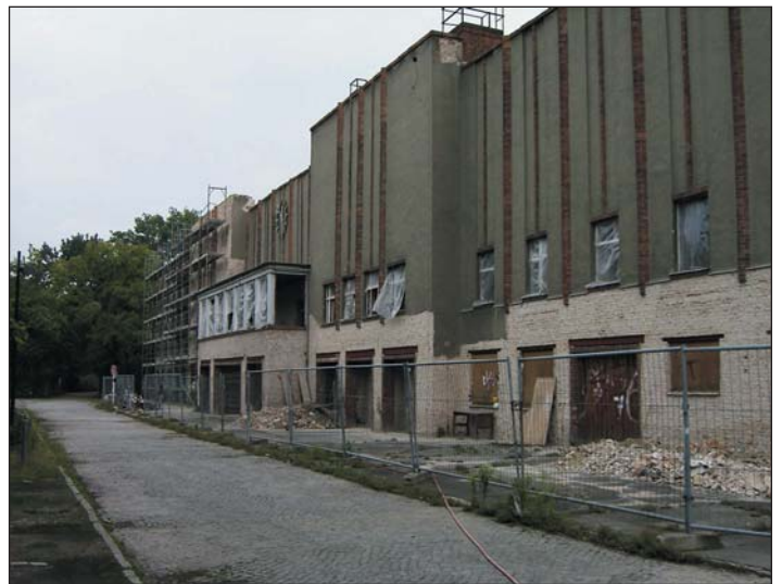
Das Tribünengebäude Mitte 2004: Die Arbeiten der beiden Stiftungen gehen voran.