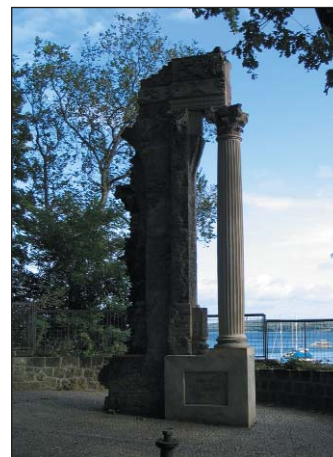
Die 2003 von der Hinckeldey-Stiftung auf Schwanenwerder restaurierte sog. Tuileriensäule.

ersten Vorhaben war die Instandsetzung und Restaurierung der Familiengrabstätte Humboldt im Park des Schlosses Tegel. Ferner konnten eine Reihe von im Krieg in Verlust geratener Skulpturen neu gegossen und aufgestellt werden, so die um 1900 von Ferdinand