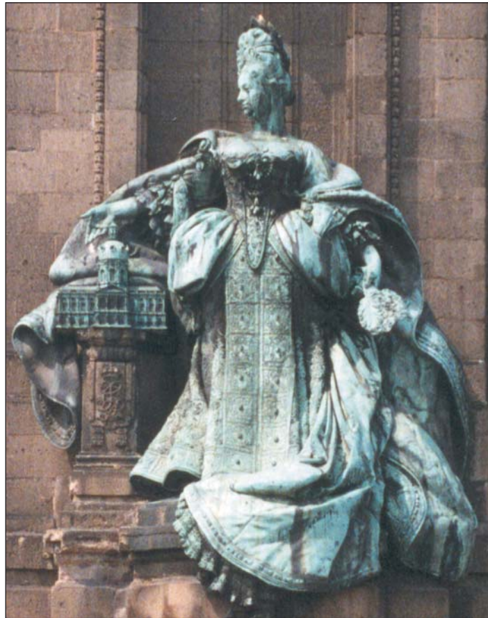
Charlottenburger Tor, Standbild der Königin Sophie Charlotte. Zusammen mit der vor dem gegenüberliegenden Pfeiler des Tores aufgestellten Statue Friedrichs I. verweist das Herrscherpaar deutlich auf die Gründungsgeschichte Charlottenburgs.

Die anstehende Restaurierung wird mit ihren drei Schadenskategorien nicht weniger kompliziert als die Entstehungsgeschichte werden: die ständige und starke Bewitterung des weichen Tuffsteins, die Kriegsschäden und auch der nachfolgende Umgang sind Ursachen. ■