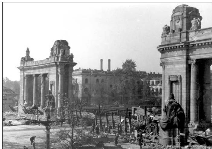
Das Charlottenburger Tor am 3. Mai 1945, von einem sowjetischen Bildberichterstatter aus dem zerstörten Westflügel des Ernst-Reuter-Hauses aufgenommen. Im Tor waren Panzersperren errichtet. Das Charlottenburger Tor wurde ebenso wie das Brandenburger Tor von den Endkämpfen um den Stadtkern in Mitleidenschaft gezogen. Erst die genaue Untersuchung des Tores wird Aufschluss über Ausmaß und Schwere der Schäden und über die Güte ihrer Behebung nach 1945 geben können.