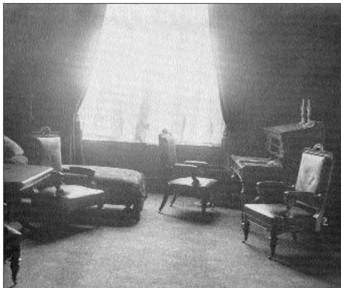
Das Arbeitszimmer Bismarcks im Provisorischen Reichstag in der Leipziger Straße. Das erste deutsche Reichstagsgebäude und damit dieser Ort wurden schon Ende des 19. Jahrhunderts für den Bau des neuen Preußischen Landtags abgebrochen.