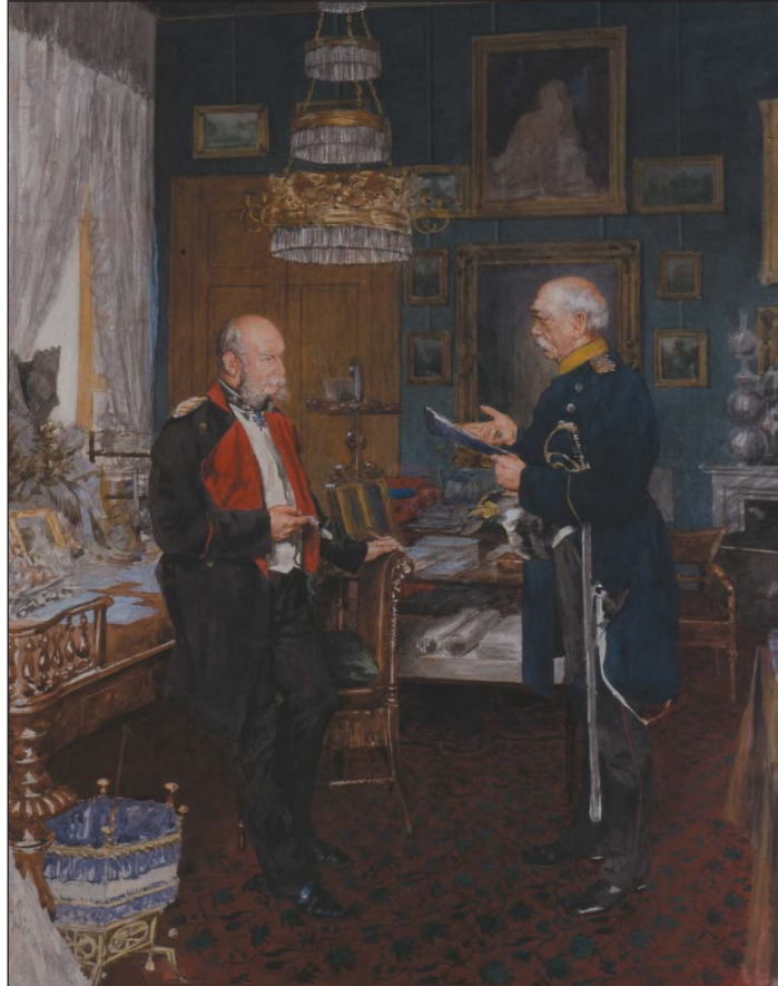
Das Arbeitszimmer Wilhelms I. im „Alten Palais“ Unter den Linden. Reichskanzler Bismarck hält Vortrag vor seinem Monarchen. Das Arbeitszimmer ist, obgleich das Palais den Krieg als Ruine überdauert hatte, so gut wie unkenntlich geworden.