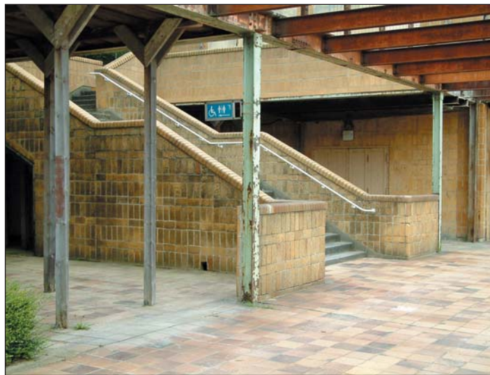
Das Strandbad Wannsee - immer noch halbe Ruine

In seiner Sitzung am 06.07.2004 hat der Senat noch vor der Sommerpause eine von der Senatsverwaltung für Stadtentwicklung erarbeitete Senatsvorlage zum Strandbad Wannsee beschlossen. Damit ist das Startsignal erteilt, die Arbeiten sachgerecht nach dem Ende der Badesaison tatsächlich beginnen zu können. Der Senatsbeschluss hatte zum Inhalt, dass die BerlinerBäderBetriebe finanziell ausgestattet werden, um besonders die technischen Versorgungsleitungen zu sanieren. Der Senat hat ferner der denkmalgerechten Restaurierung von Teilbereichen des Strandbades Wannsee durch die Stiftung Denkmalschutz zugestimmt, wobei die Maßnahmen abgestimmt auf den Mittelzufluss in sinnvollen Bauabschnitten ausgeführt werden. Und für die Stiftung Denkmalschutz Berlin ebenso wichtig ist, dass die ständige Pflege des Baudenkmals zum Schutz vor Verfall und Verwahrlosung von den BerlinerBäderBetrieben im Rahmen des jeweiligen Wirtschaftsplanes gesichert werden muss. Nach Abschluss der Restaurierung soll das Strandbad weiterhin im Landeseigentum verbleiben und damit ist eine Befürchtung der Stiftung aus-