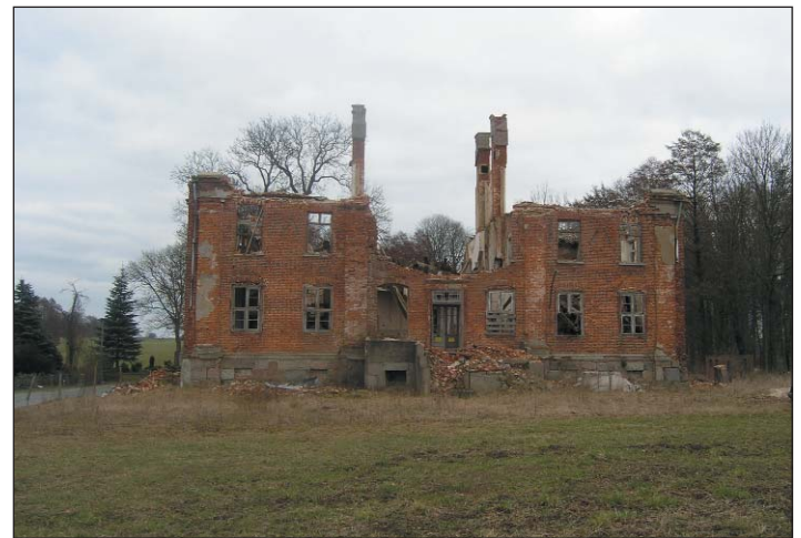
Die - romtansische - Ruine als sinnfälliger Ausdruck von halbiertem Gedächtnis ?

Beschleunigung und die damit einhergehende Gegenwartsschrumpfung erzeugen in uns das Gefühl, daß unser Wissen und unsere Erfahrungen immer schneller veralten und damit entwertet werden. Deshalb gibt es in unserer Gesellschaft auch nicht mehr die weisen alten Männer/Frauen, die nichts erschüttern kann, weil sie alles gesehen hatten: Sommer und Winter, Geburt und Tod, Dürre und Kälte, Hitze und Fruchtbarkeit. Alter ist heute kein Zeichen mehr für Er-