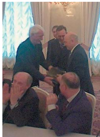
Senator Strieder und Staatssekretär Stimmann überreichen Jurij Luschkov einen Originalstein des Tores.

Am 3. Oktober 2002 wurde das restaurierte Baudenkmal von der