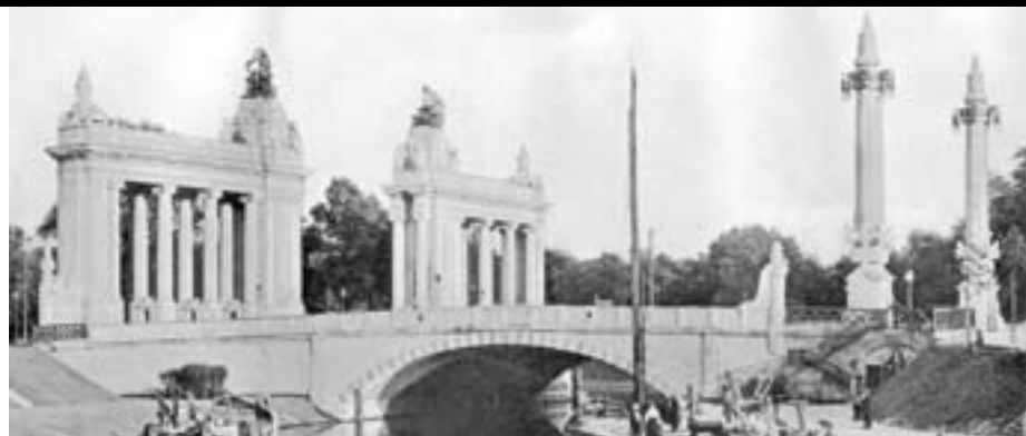
Die alte Charlottenburger Brücke mit Tor und Kandelabern nach 1908