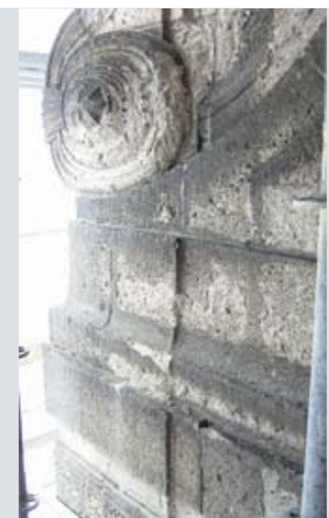
Zerstörte Tuffsteinoberflächen 2004, die restaurierte Torverzierung 2008