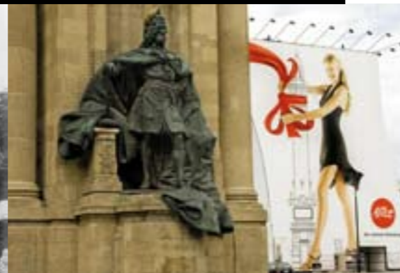
Friedrich I. mit Alice 100 Jahre später