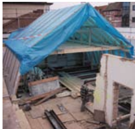
Das neue Mansarddach in der ursprünglichen barocken Form wird errichtet.