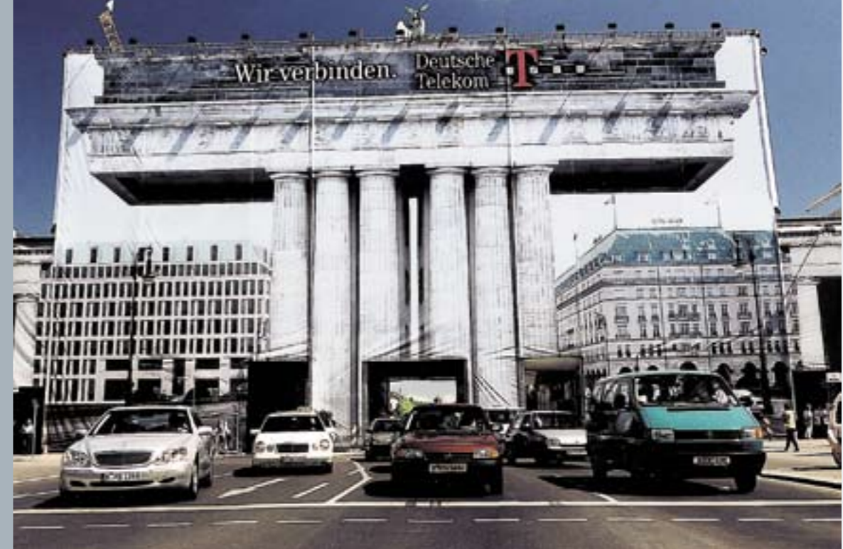
Brandenburger Tor 2001 und 2002 – Großflächenwerbung mit großem Anspruch

vor allem Geld. Jeder weiß, dass in Berlin Geld nicht in dem Maße zur Verfügung steht, wie wir uns das alle wünschen würden. Auch deshalb ist das bürgerschaftliche Engagement für Denkmale notwendig. Die Stiftung Denkmalschutz Berlin hat in denen vergangenen zehn Jahren von rund 2.000 Spendern mehr als eine Millionen Euro als Spenden erhalten. Das ist ein kostbarer Vertrauensbeweis und ein kraftvolles Bekenntnis zu Berlins Denkmalen. Hinzu kamen Fördermittel der Job-Center in siebenstelliger Größenordnung, da bei fast allen Stiftungsprojekten Qualifizierungsmaßnahmen integriert werden. Da die Arbeit der Stiftung nicht durch die Zinsen ihres Stiftungskapitals finanziert werden kann, kamen als drittes und größtes Standbein die Einnahmen durch Werbung hinzu, die sich auf insgesamt etwa 12 Millionen Euro beliefen. Dadurch war es möglich, neun Denkmale des Landes Berlin zu restaurieren, vom Brandenburger Tor über das Charlottenburger Tor bis zum Strandbad Wannsee. Neben diesen Objekten, die das Bild der Stadt prägen, haben wir uns aber auch einigen kleineren, ja versteckten Denkmale angenommen wie der Waldkapelle Hessenwinkel oder den Kaskaden am Lietzensee.