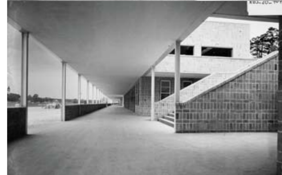
Die schattigen Wandelgänge des Strandbads vor dem Restaurant Lido und den Umkleidehallen in den 20er Jahren

Zudem entwarf die Stiftung ein neues Betriebskonzept für das Strandbad, mit Nutzungsideen für die einstigen Umkleidehallen sowie zur Verpachtung der Laden- und Restaurantflächen. Ziel war ein Ganzjahres-Betrieb mit Sauna-, Wellness- und Fitness-Angebot, guter Gastronomie, Event-Locations und einer Stärkung der Jugend- und Sportarbeit. Kompetente Partner standen bereit.