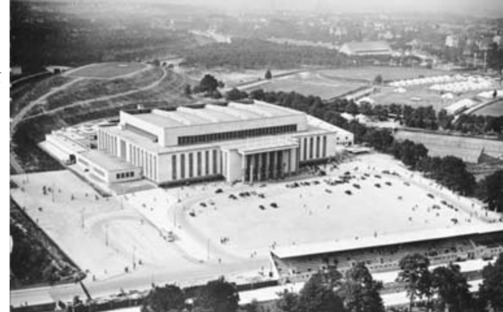
Die Deutschlandhalle an der Avus in den 30er Jahren. Ihr geplanter Abriss erregt derzeit die Denkmalschützer in Berlin.

Zehn Jahre Stiftung Denkmalschutz Berlin: Da es nicht an Glückwünschen und Lobreden fehlen wird, können auch ein paar bittere Tropfen im Wein nicht schaden. Und zwar diese: