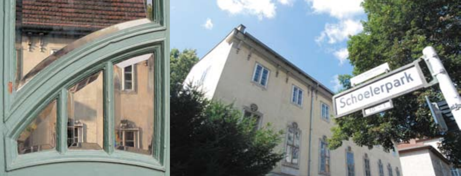
Das Schoeler-Schlösschen mit Aufstockung von 1935 und Notdach