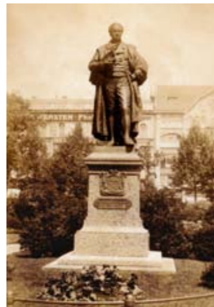
Das seit 1945 verlorene einstige Hardenberg-Denkmal auf dem Dönhoff-Platz – eine Rekonstruktion entsteht dank einer Großspende und soll gegenüber dem Denkmal für den Freiherrn von Stein vor dem Abgeordnetenhaus aufgestellt werden.

Das Gespräch führte Dr. Jürgen Tietz, Architektursturkritiker in Berlin.