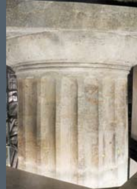
Das Brandenburger Tor vor der Sanierung Ende der 90er Jahre

Vorher-Nachher: unsachgemäße Ausbesserungen an den Säulen wurden fachgerecht und sorgfältig behoben.