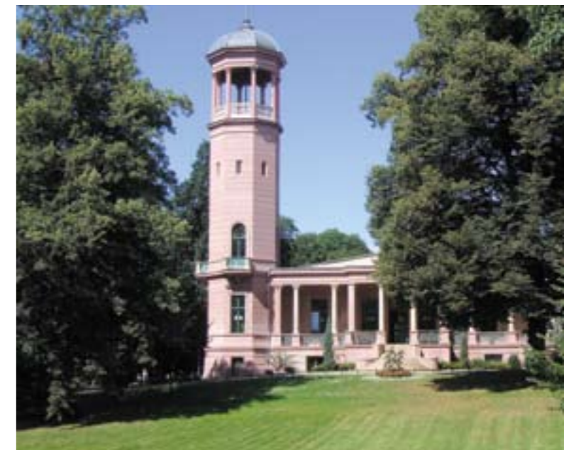
Die Siemens-Villa vor der Zerstörung – und 2008 nach der Fassaden- und Turmsanierung