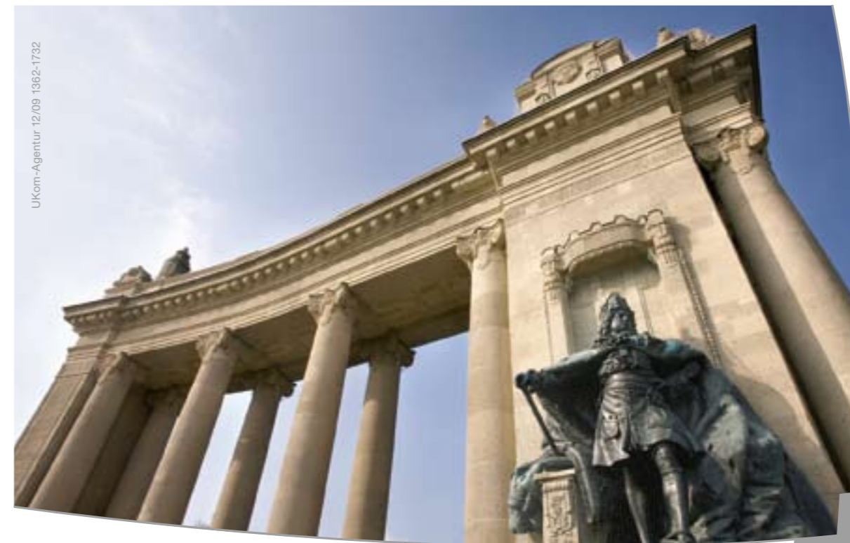
UKom-Agentur 12/09 1362-1732

Der Träger des Bühnerpreises, Martin Mosebach, sagte: „Die meisten Leute sind der Traditionslosigkeit überhaupt nicht gewachsen.“ Er zitierte einen wunderschönen Satz von Dali: „Wer sich nicht der Tradition unterwirft, ist dazu verurteilt, Plagiate her-