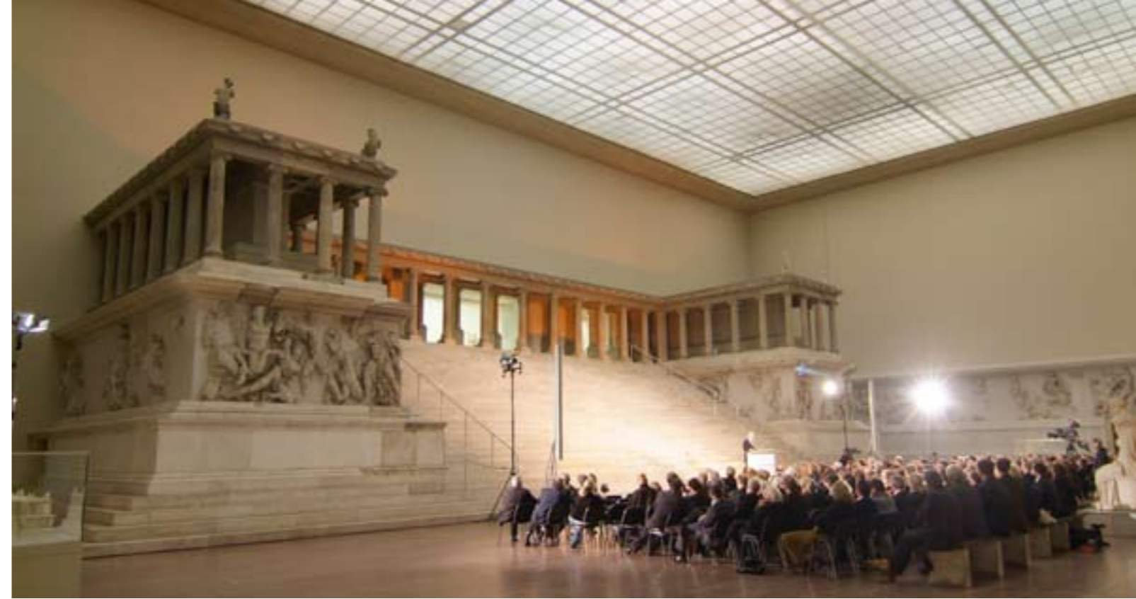
Dr. Norbert Lammert, Präsident des deutschen Bundestags und Schirmherr der Stiftung Denkmalschutz Berlin sprach am 6. November 2007 im Pergamon-Museum auf Einladung der Stiftung zum Thema „Bürgergesellschaft und Erinnerungskultur“. Der Vortrag wird hier erstmals dokumentiert.

Zur „Demokratie als Bauherr“ gehört nicht nur, den Bürger im funktionalistischen Sinn bei Städtebau und Architektur als Mitglied eines demokratischen Gemeinwesens zu sehen, nein, ein solches Gemeinwesen bedarf auch der „höheren Gefühlskräfte“, der Bindung an Geschichte, um dieses Gemeinwesen zur Heimat werden zu lassen.