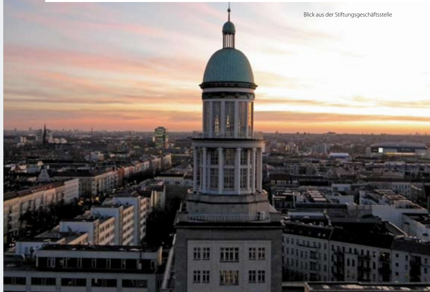
Blick aus der Stiftungsgeschäftsstelle

Jürgen Tietz: Die Stiftung Denkmalschutz Berlin hat vor zehn Jahren ihre Arbeit auf Anregung des Abgeordnetenhauses und des Senats von Berlin aufgenommen. Wozu braucht Berlin eigentlich eine Denkmalstiftung?