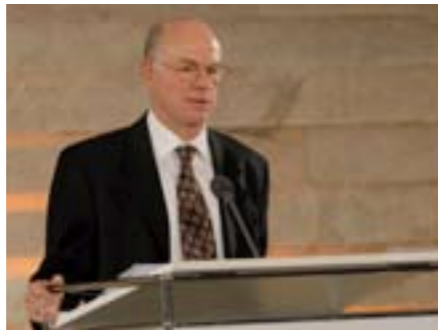
Dr. Norbert Lammert, Präsident des Deutschen Bundestags, vor dem Pergamonaltar