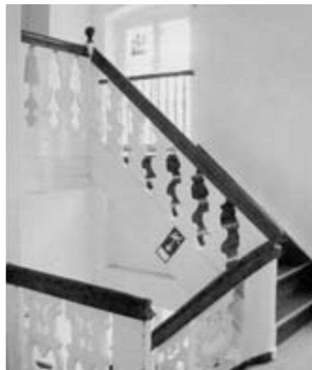
Das barocke Treppenhaus aus dem 18. Jahrhundert. Die Oberste Denkmalbehörde beim Senat verlangt absurderweise den Abbruch des abgebildeten Treppenlaufs aus dem 19. Jahrhundert.